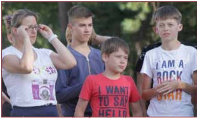
открытие третьей юбилейной смены лагеря «Горный» страница 2