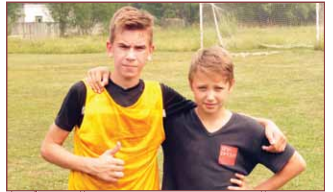
футбольный поединок между командой первого и сборной второго и третьего отрядов страница 4-5