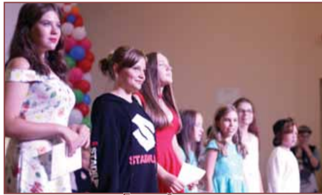
таланты лагеря «Горный» страница 8-11